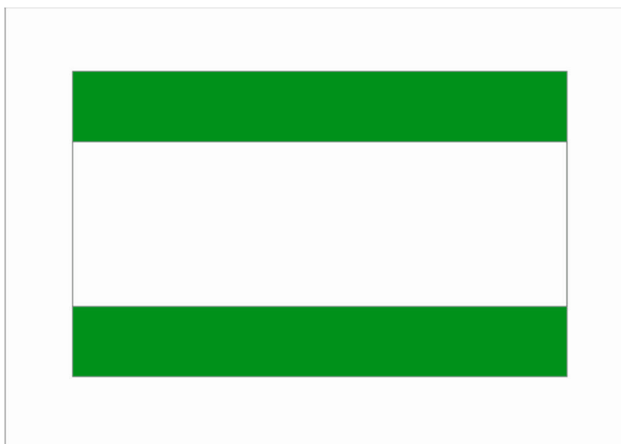
Flaga w wersji codziennej