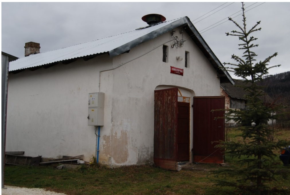
Jaworek. Świetlica wiejska