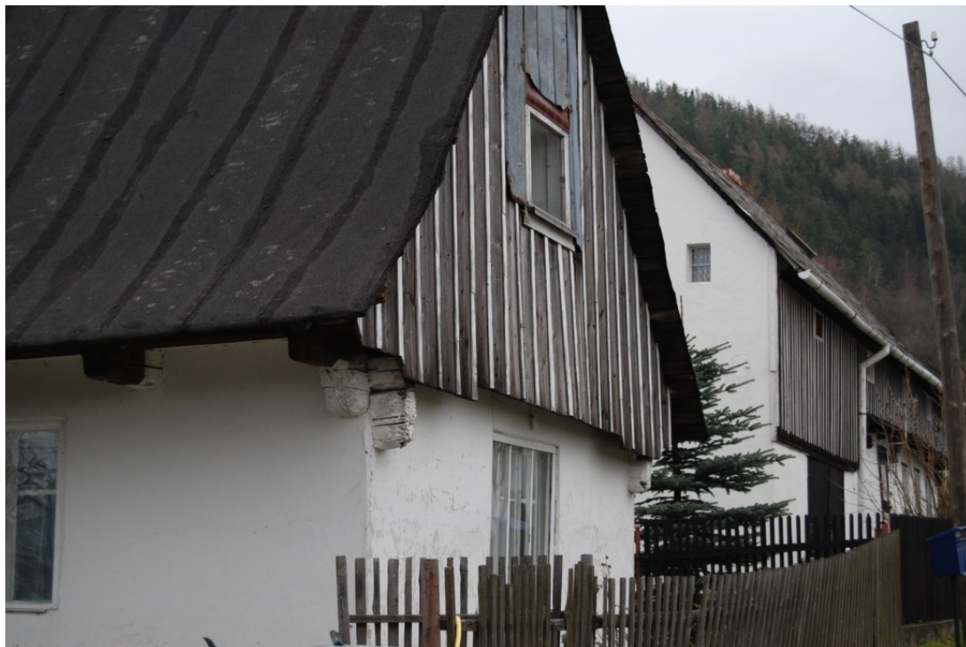
Jaworek. Tradycyjna zabudowa