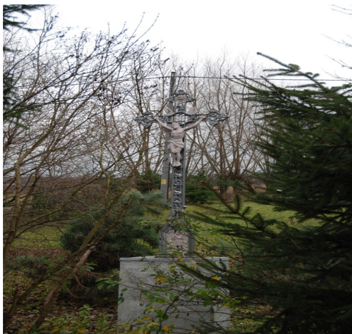
Jaworek. Krzyż przydrożny