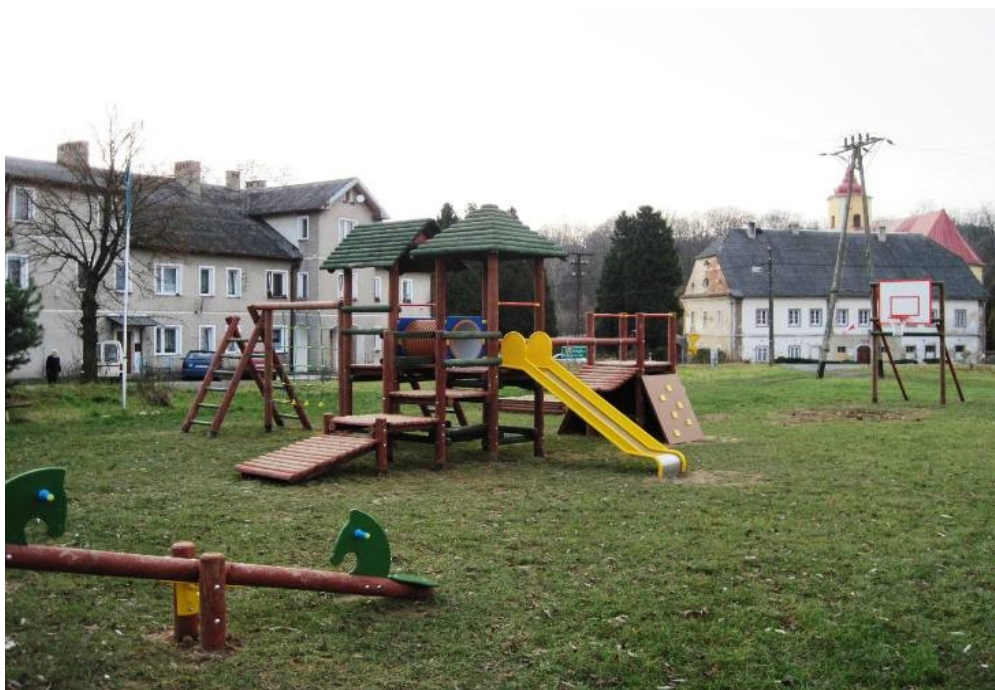
Roztoki. Plac zabaw