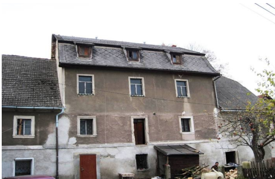
Roztoki. Dawny młyn