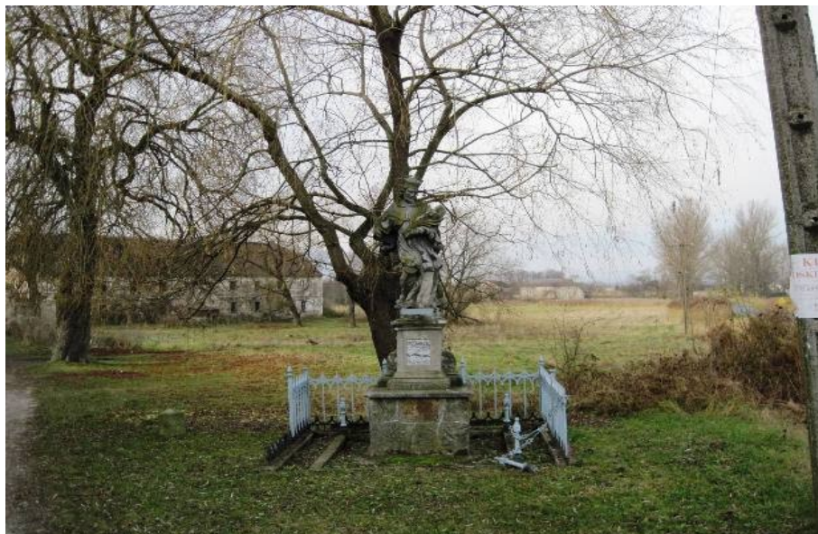
Roztoki. Figura św. Jana Nepomucena