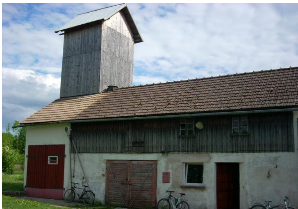
Roztoki. Remiza strażacka